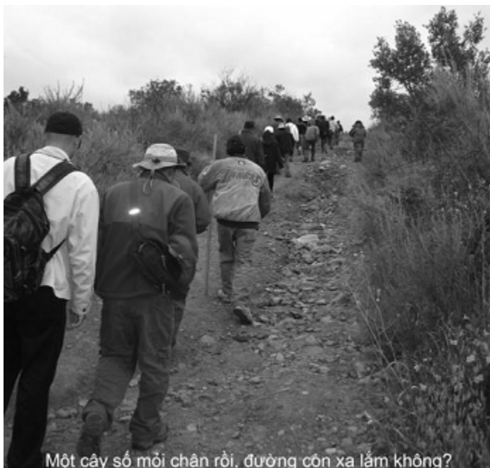
Một cây số mỗi chân rồi, đường còn xa lắm không?