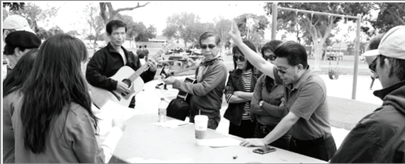
Phụ Huynh tập hát cho TS-35